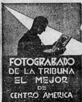
FOTOGRAFADO DE LA TRIBUNA EL MEJOR DE CENTRO AMERICA