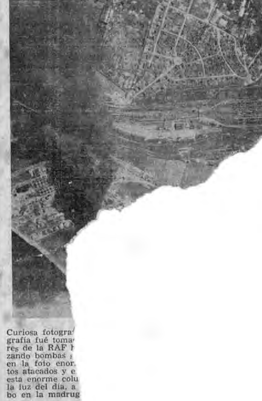
Curiosa fotografía fue tomada por el estado mayor alemán cuando lanzando bombas en la foto enorme atacados y en esta enorme columna la luz del día, a bo en la madrugada

que ser fuerte de no menos de medio millón de hombres los que se podrían transportar en siete días. ¿Cómo, existiendo la flota inglesa? Es ese el problema. Pero un ataque en grandes masas hecho por la aviación contra las bases navales inglesas o las concentraciones de la flota enemiga y la persecución de los escuadrones de barcos de guerra por el Atlántico y alrededor de las islas no es cosa difícil si se tiene a mano una gran fuerza aérea.